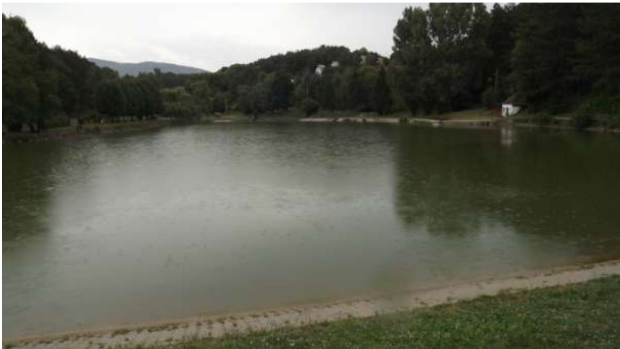
A Dombay tó Pécsvárad mellett.

Egy kis levezető séta a közeli Dombay tóhoz. A kissé kellemetlen időjárás és a megint csak szemerkélő eső miatt, csak egy kis nosztalgikus emlékezés lett belőle, az itthon korábban eltervezett fürdőzés helyett. ☹ ( A kép készítésekor csak egy-egy bátor turista lézengett a tó körül rajtunk kívül. )