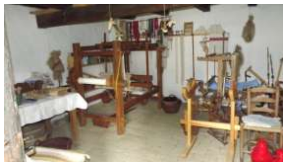
Képek a Szennai skanzernból