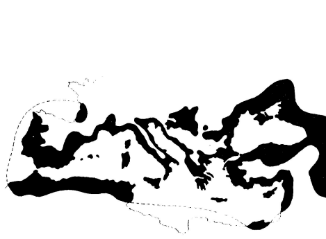
A hegyeslevelű kőr elterjedése (CSAPODY—CSAPODY—ROTT 1966, 194. o.)