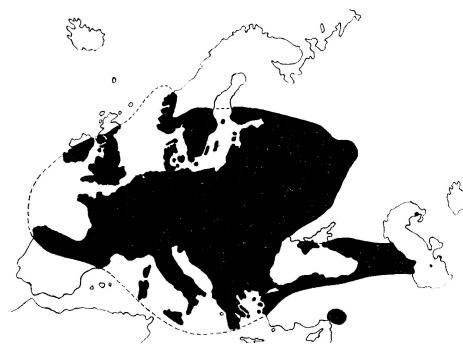
A magaskőr elterjedése (CSAPODY—CSAPODY—ROTT 1966, 192. o.)